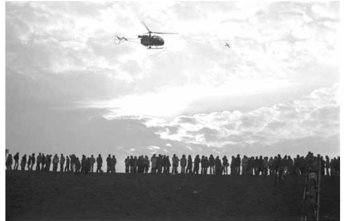
Hubschraubereinsatz gegen Demonstranten, Brokdorf, 1981

steht sich als politischer Fotograf, er gilt als Vorreiter eines sozial engagierten und aufklärerischen Bildjournalismus der jungen Bundesrepublik. Zint war Hausfotograf im Hamburger Star-Club,