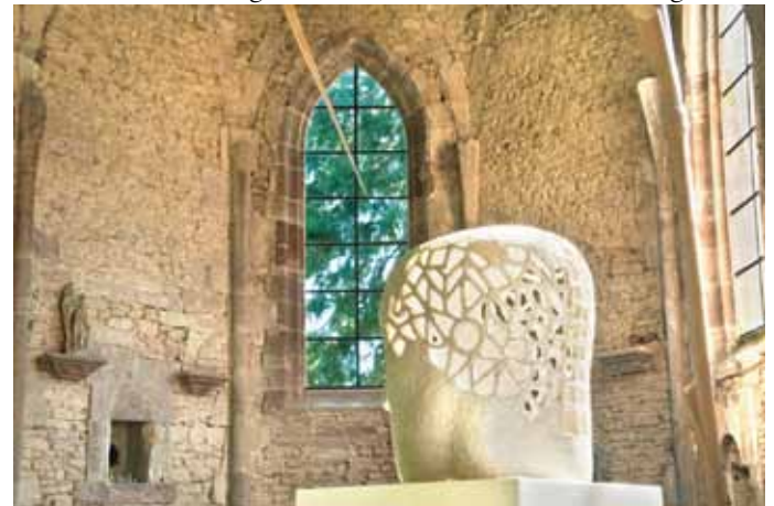
Kopfskulptur des Künstlers Genc Mulliqi am KulturOrt Wintringer Kapelle

Hintergrund: Der KulturOrt Wintringer Kapelle auf dem Wintringer Hof gehört zu den Orten der Kunst und Kultur im Regionalverband Saarbrücken und versteht sich in der Gegenwart als Denk- und Lernort, an dem auch künstlerische Reflexionen zum Innehalten und Weiterdenken inspirieren. Entwickelt und inhaltlich betreut wird das Kulturprojekt im Rahmen der Regionalentwicklung des Regionalverbandes Saarbrücken durch Kulturreferent Peter Michael Lupp. Kooperationspartner sind die Lebenshilfe für Menschen mit Behinderung Obere