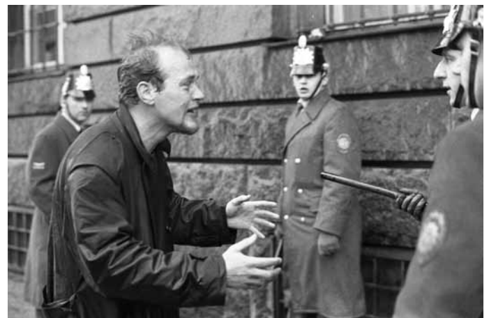
Weinender Demonstrant, Berlin 1968

dem Hamburger Star-Club oder die Bilder protestierender Studenten in Berlin 1968. „Ich will Realität zeigen, meine Bilder sind Gebrauchsfotografien“, sagt Zint über seine Arbeiten. Im Mittelpunkt stehen Motive aus dem Hamburger St.-Pauli-Kiez sowie Fotos der Studenten-, Friedens und Anti-Kernkraft-Bewegung. Günter Zint, 1941 geboren, ver-