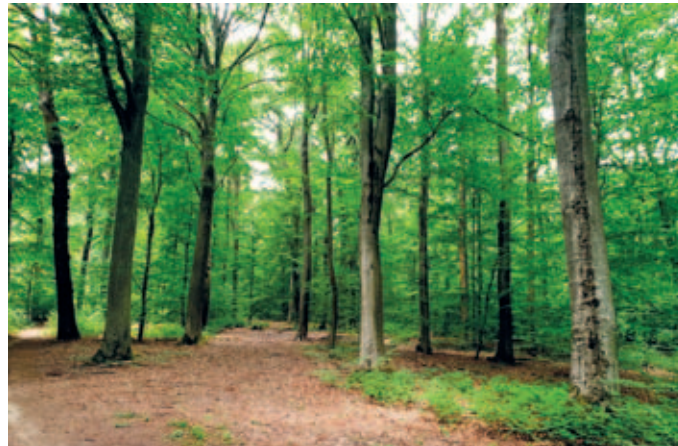
Geplanter Standort WEA 02, August 2020. Altholzbestand, vor allem Buchen, ca. 130 Jahre alt.

Es gibt traurige Neuigkeiten: Im Krughütter Wald sind die Holzfäller angerückt. Sie haben dort, wo die Windräder gebaut werden sollen, großflächig Bäume abgeholzt. Mit schwerstem Gerät, äußerst brutal und rücksichtslos. Beim Ortstermin am 13. Februar standen wir vor einem Bild der Verwüstung. Auffällig war, dass das Zerstörungswerk im südlichen Teil des Waldes begonnen wurde, der am weitesten entfernt liegt von der Klarenthaler Ortslage und wegen nasser Witterung und vermatschter Waldwege derzeit weniger von der Bevölkerung aufgesucht wird als der nördliche, siedlungsnaher Teil. Auffällig auch, dass Harvester und andere schwere Maschinen mitnichten offen am Wegesrand geparkt wurden, sondern regelrecht versteckt im (Rest-)Bestand in der Nähe des geplanten WEA02-Standorts. Das alles spricht dafür, dass man die Aktion gezielt vor der Bevölkerung verbergen wollte. Und der Anblick, der sich uns bot, zeugte davon, dass man in größter Hast gearbeitet hat, Hauptsache Baum ab.