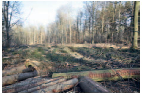
Geplanter Standort WEA 02, Februar 2022.

Kontakt (E-Mail): info@bi-klarenthal-gersweiler.de (wenn Sie dort eine Telefonnummer hinter-