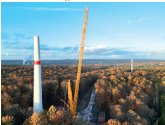
Blick auf die Baustelle der WEA 01, aufgenommen am Donnerstag, 24. November, von der Forbacher „Eurozone“ aus. Auf dem Weg zur Baustelle stehen nach kräftigen Herbst-Regengüssen tiefe Wasserpfützen. Hinten rechts der Teil-Turm für WEA 02, im Hintergrund links erkennt man das Kraftwerk Fenne.

Bürgerinitiative zum Schutz von Umwelt und Natur in Klarenthal-Gersweiler und Umgebung e. V.