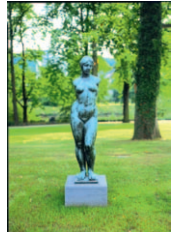
Aristide Maillol, Venus sans bras, 1920, Foto Stiftung Saarländischer Kulturbesitz

le.naumann@rvsbr.de, über www.vhs-saarbruecken.de oder persönlich beim Zentralen Service im Alten Rathaus am Saarbrücker Schlossplatz.