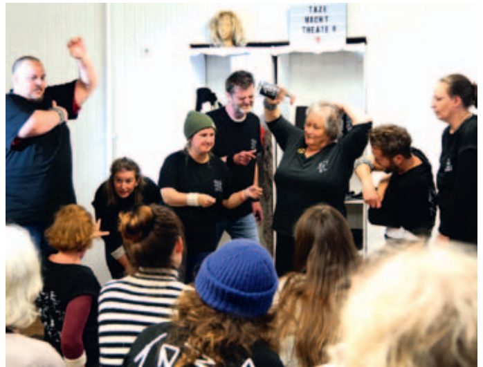
Starker Ausdruck beim „Gruppenbild“ in der Theateraufführung der Diakonie-Einrichtung TaZe