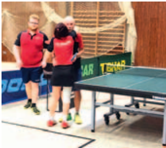
Bei Heimspielen ist die Halle gut gefüllt.

Seniorenteam gewann mit 8:2 bei der Berschweiler Reserve. Doch der im negativen Sinne krachende Jahresabschluss täuscht darüber hinweg, dass sich die im Umbruch befindlichen und personell auf Kante genähten Mannschaften in der Hinrunde gut verkauft haben. Teilweise als klare Abstiegsandidaten gestartet, steht 2025 kein Team auf einem Abstiegsplatz.