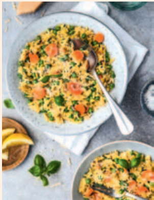
Lecker und leicht: Orzotto mit Erbsen- und Karotten-Rahm lassen sich ganz einfach nachkochen.