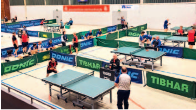
Die dritte Mannschaft überraschte in der Hinrunde.

Seniorenteam gewann mit 8:2 bei der Berschweiler Reserve. Doch der im negativen Sinne krachende Jahresabschluss täuscht darüber hinweg, dass sich die im Umbruch befindlichen und personell auf Kante genähten Mannschaften in der Hinrunde gut verkauft haben. Teilweise als klare Abstiegsandidaten gestartet, steht 2025 kein Team auf einem Abstiegsplatz.