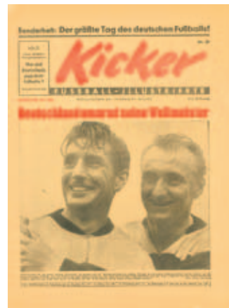
Kicker-Sonderheft zur Fußball-WM 1954

anhand ausgewählter Originale nachgezeichnet wird. Zwischen der Verkündung des Grundgesetzes am 23. Mai 1949 und der Wiedervereinigung am 3. Oktober 1990 lagen 41 Jahre, in denen es zwei deutsche Staaten gab, die BRD im Westen und die DDR im Osten – getrennt durch den „eisernen Vorhang“ des Kalten Krieges und die gegensätzlichen politischen Systeme: Demokratie im Westen und Diktatur im Osten. Die Geschichte der BRD ist letztlich – trotz aller Krisen – eine Erfolgsstory. Auf den Trümmern des zerstörten nationalsozialistischen Deutschlands wurde in Westdeutschland ein demokratischer und föderalistischer Staat aufgebaut, der vor allem dank des Wirtschaftswunders in den 1950er Jahren rasch zu einem Erfolgsmodell wurde. Bedingt durch den Kalten Krieg kam Deutschland in den vier Jahrzehnten der Teilung eine ent-