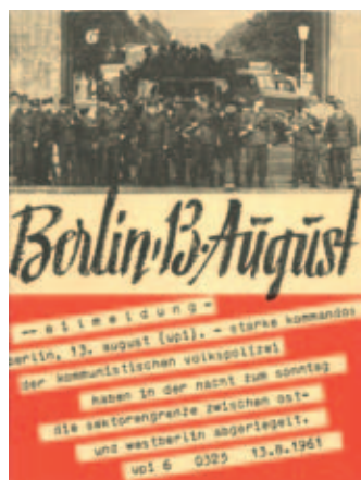
Broschüre zum Mauerbau 1961 / Sammlung Deutsches Zeitungsmuseum

Informationen zur Vermietung erhalten Sie bei Uschi Nachtigall unter Tel.-Nr.: 0152-539 521 53 sowie Jörg Kuhn unter Tel.-Nr.: 0160-99 30 28 52