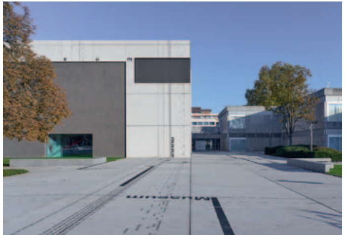
Außenansicht der Modernen Galerie des Saarlandmuseum

wichtig, das Museum trotz der Umbauarbeiten für Museums-gäste zugänglich zu halten. Im Erweiterungsbau (Trakt B) sind die zeitgenössische Sammlung sowie die aktuelle Ausstellung Re:start – Gestalterische Positionen für bessere Zukünfte uneingeschränkt zu besichtigen. Das Projekt Re:start , kuratiert von Mark Braun, Professor für Produktdesign und Gestalter, zeigt anhand von Arbeiten junger Gestalter*innen, wie aktuellen Herausforderungen des Klima-