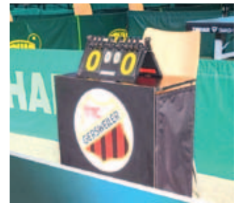
Ende August beginnt die neue Tischtennis-saison.