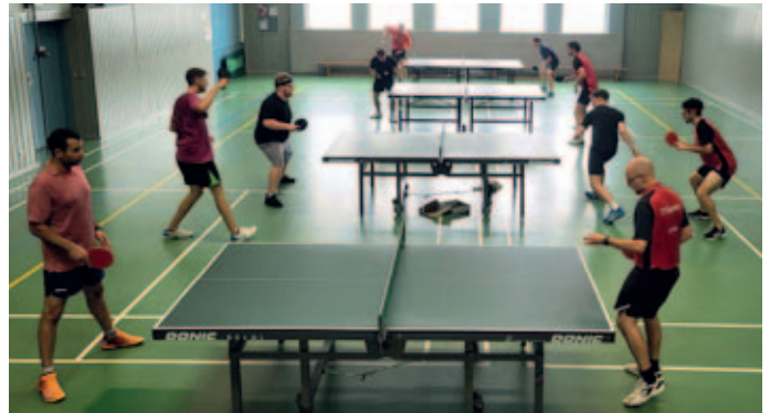
Die US Forbach TT war zum Testspiel zu Gast.