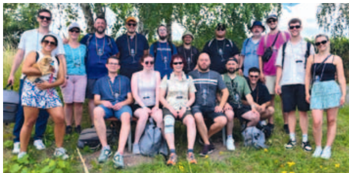
Die Vereinsfahrt in die Weinberge war ein voller Erfolg.