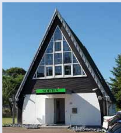
Firmensitz mit hoher Wiedererkennung. In der ehemaligen Neupostlichen Kirche in Saarbrücken-Gersweiler werden heute umfangreiche Personaldienstleistungen durch die SOFITEX GmbH angeboten.