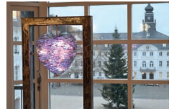
BU: Die Glas-Stahl-Konstruktion von Markus Hohlstein im Mittelbau des Saarbrücker Schlosses bei Tag/Nacht.

Ein gläsernes Herz strahlt seit einigen Tagen im Mittelbau des Saarbrücker Schlosses. Es handelt sich dabei um eine Glas-Stahl-Skulptur des Saarbrücker Künstlers Markus Hohlstein, der zuvor schon mehrere große Glaskunstwerke an gleicher Stelle platziert hatte. Das gläserne Herz besteht aus etwa 2.000 Glasscherben und hat einen ungefähren Durchmesser von 40 Zentimetern. Durch mehrere Mikro-LED-Leuchten kann das Herz in bis zu drei Farben gleichzeitig von innen heraus beleuchtet werden. Dadurch bietet sich dem Betrachter in den Abendstunden ein atmosphärisches Licht im Mittelbau. Regionalverbandsdirektor Peter Gillo: „Wer noch einen passenden Ort für einen Heiratsantrag sucht, wird vor dem rot leuchten-