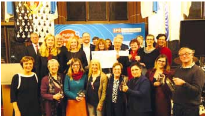
Bildunterschrift: Verleihung des Kommunalen Bügeleisen.

diesem Jahr für große Verdienste um die Stadtgesellschaft verliehen. Geehrt wurden die Saarbrücker Gemeinwesenprojekte. Das sind die Gemeinwesenarbeit Wackenberg (PÄDSAK), das BürgerInnenZentrum Brebach, das Kontaktzentrum Folsterhöhe, die Stadtteilbüros Alt-Saarbrücken, Burbach und Malstatt, die Zukunftsarbeit Molschd (ZAM) und seit Anfang des Jahres die Gemeinwesenarbeit Dudweiler-Mitte. Oberbürgermeisterin