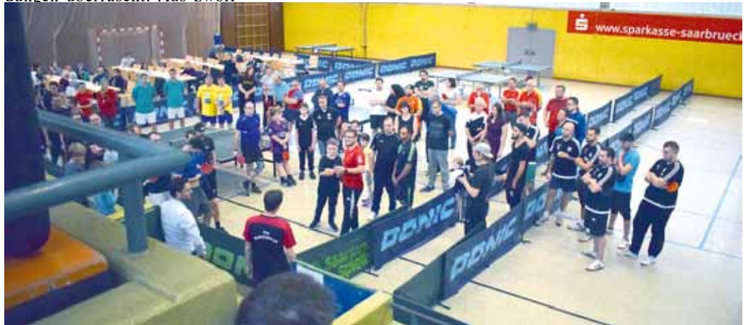
Insgesamt 32 Teams sind ins Sportzentrum Gersweiler gekommen.

fiel also leider aus. Entschädigt wurden die zahlreichen Zuschauer, die es sich auf den Tribünen und an den Tischen entlang der Spielboxen gemütlich gemacht hatten, vom Spektakel in der